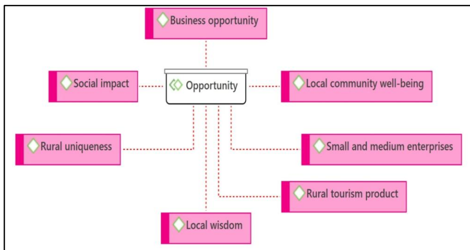
Gambar 1 Peluang Desa wisata menuju prinsip berkelanjutan

Di desa kami, belum banyak menyediakan homestay padahal banyak wisatawan meminta untuk two days package dengan menginap. Mereka ingin merasakan kehidupan di desa, tapi sayang kami belum siap untuk menyediakan sebanyak sesuai permintaan rombongan wisatawan. Kami hanya punya 3 homestay yang sudah siap untuk dijadikan tempat menginap, padahal homestay bisa menjadi peluang menambah pendapatan bagi masyarakat. (AL, Ketua Desa wisata)