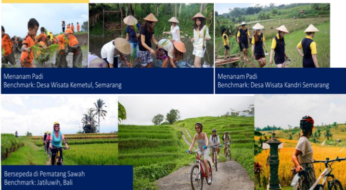
Menanam Padi Benchmark: Desa Wisata Kemetul, Semarang