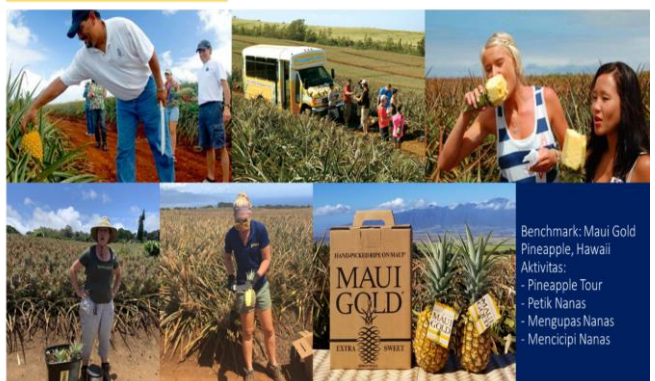
Benchmark: Maui Gold Pineapple, Hawaii Aktivitas: - Pineapple Tour - Petik Nanas - Mengupas Nanas - Mencicipi Nanas